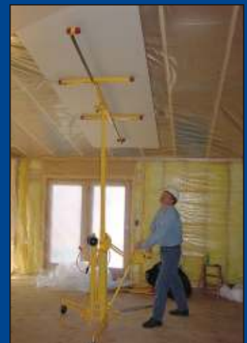
Leicht erreichbar: 355 cm Deckenhöhe