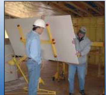
Abkipperbarer Schlitten. Beladehöhe: 86 cm