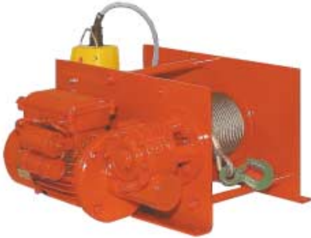
Figur 43/86 E Liftboy mit Wechselstrommotor Type 43/86 E Liftboy with single phase current motor Série 43/86 E Liftboy avec moteur pour courant monophasé