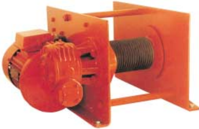
Figur 43/86 E Liftboy mit Drehstrommotor Type 43/86 E Liftboy with three phase current motor Série 43/86 E Liftboy avec moteur pour courant triphasé