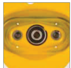
Kugellager im Getriebedeckel