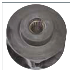
Nadellager im Lastkettenrad