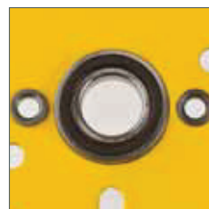
Kugellager in Seitenplatte